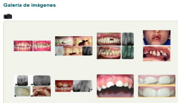
Figura 3. Sección Galería de imágenes

La Sección Galería de imágenes permite acceder a una colección de imágenes relacionadas con la temática en cuestión. Al pasar el puntero del mouse por encima de la imagen o video se mostrará una descripción de la misma, y dando clic encima, se reproducirá en la pantalla (Figura 3).