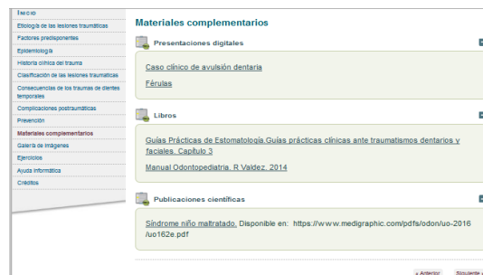
Figura 2. Sección de materiales complementarios

En la sección de materiales complementarios se mostrarán todas aquellas bibliografías y complementos bibliográficos distribuidos en tres categorías: Presentaciones digitales (power point), Libros y Publicaciones científicas. Una vez seleccionado el material que se desee consultar, este se mostrará en la pantalla, además permite ser descargado en el momento que se desee (Figura 2).