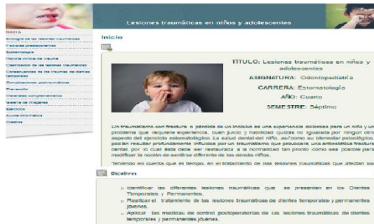
Figura 1. Página de Sección de Inicio

En la Sección de Inicio se ofrecen los datos relevantes del producto: título, asignatura, carrera, año, semestre, la imagen de presentación, la información inicial y objetivos de la multimedia (figura 1).